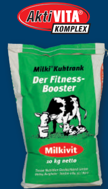
10 kg Sack