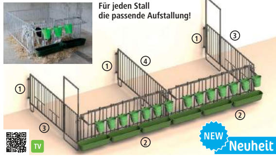
Für jeden Stall die passende Aufstallung!